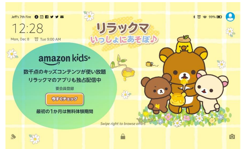
リラックマ いっしょにあそぼ♪ 2021年8月4日 提供開始