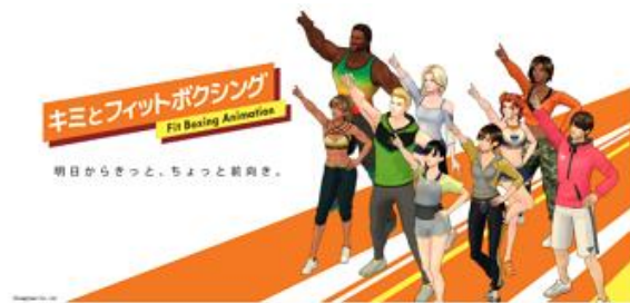
シリーズ原作アニメ「キミとフィットボクシング」 (2021年10月1日より放送)

※全世界累計出荷販売本数とは、各販売地域のパッケージ版累計出荷本数並びにダウンロード版の累計配信本数を合算した本数です。