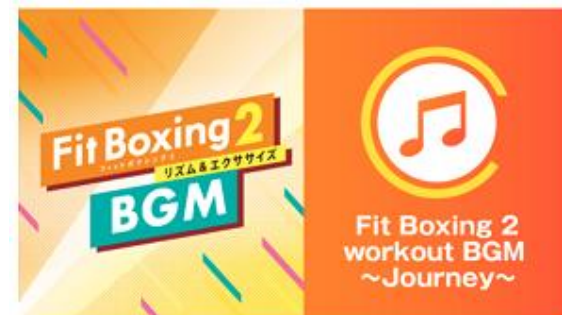
BGM追加ダウンロードコンテンツ配信開始