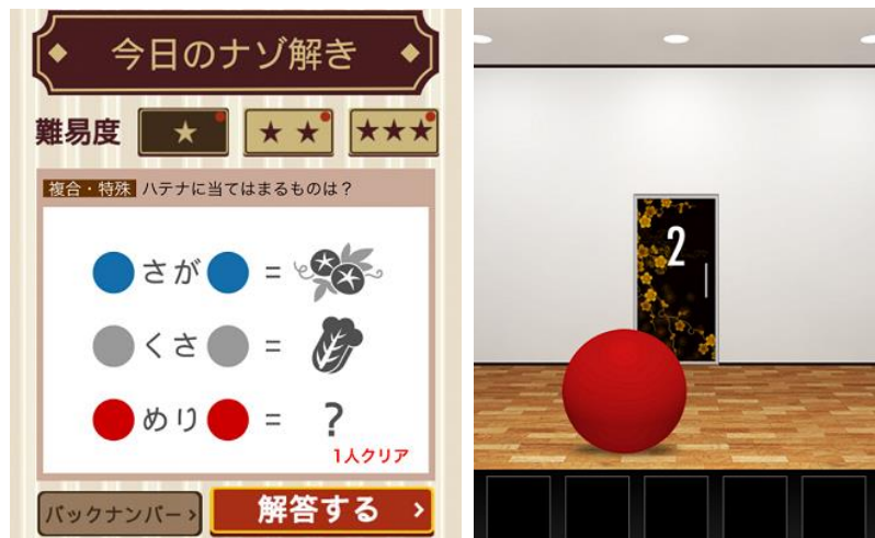
ナゾ解きの館 for スゴ得 2021年7月20日 提供開始

NTTドコモが運営する「スゴ得コンテンツ®」にて、「ナゾ解きの館 for スゴ得」の提供を開始しました。また、Amazonが運営する子ども向け定額サービス「Amazon Kids+」にて知育アプリ「リラックマ いっしょにあそぼ♪」の提供を開始しました。