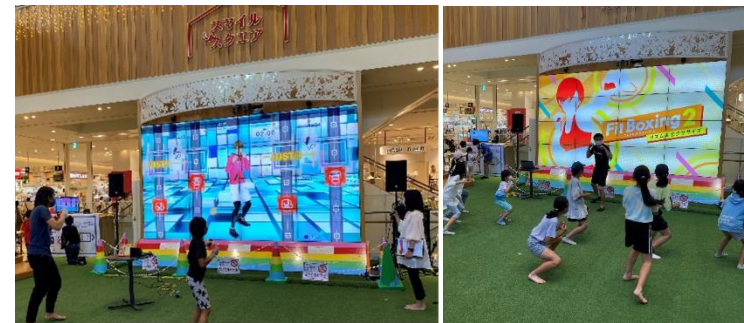
川崎市中原区主催「KOSUGI SPORTS FES」