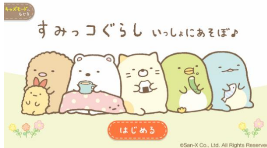
すみっコぐらし いっしょにあそぼ for dキッズ 2020年10月7日 提供開始

NTTドコモが運営する「スゴ得コンテンツ®」及び「dキッズ®」向けに計3タイトルの提供を新たに開始しました。