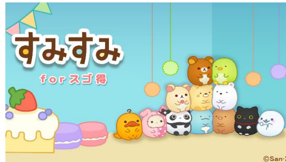
すみすみ forスゴ得 2020年12月15日 提供開始