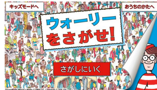
ウォーリーをさがせ! for dキッズ 2020年12月1日 提供開始