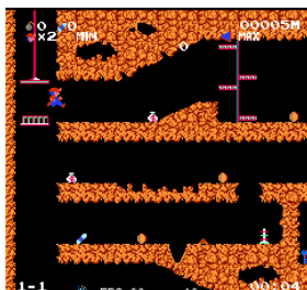
【ファミコン版画面】