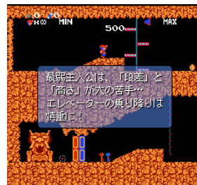
【チュートリアル版画面】