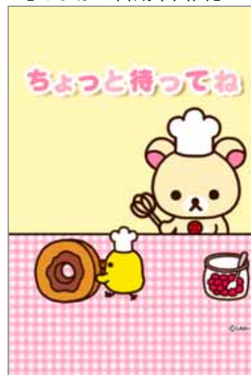
【おまかせ合成中画面】