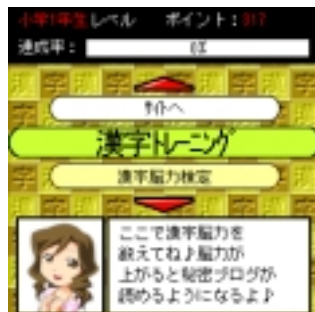
【アプリメニュー画面】